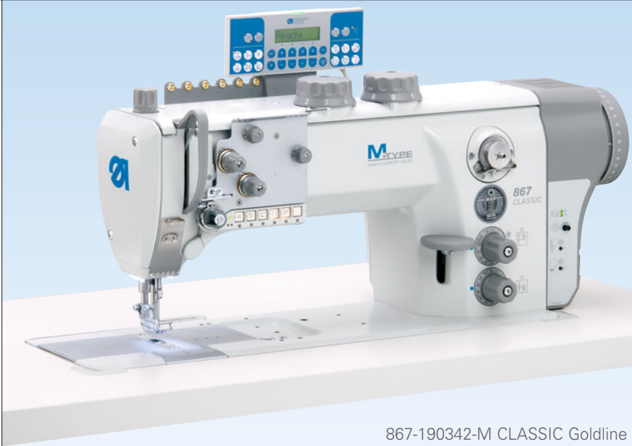
867-190342-M CLASSIC Goldline

Die leistungsstarken Unterklassen / The highly efficient subclasses