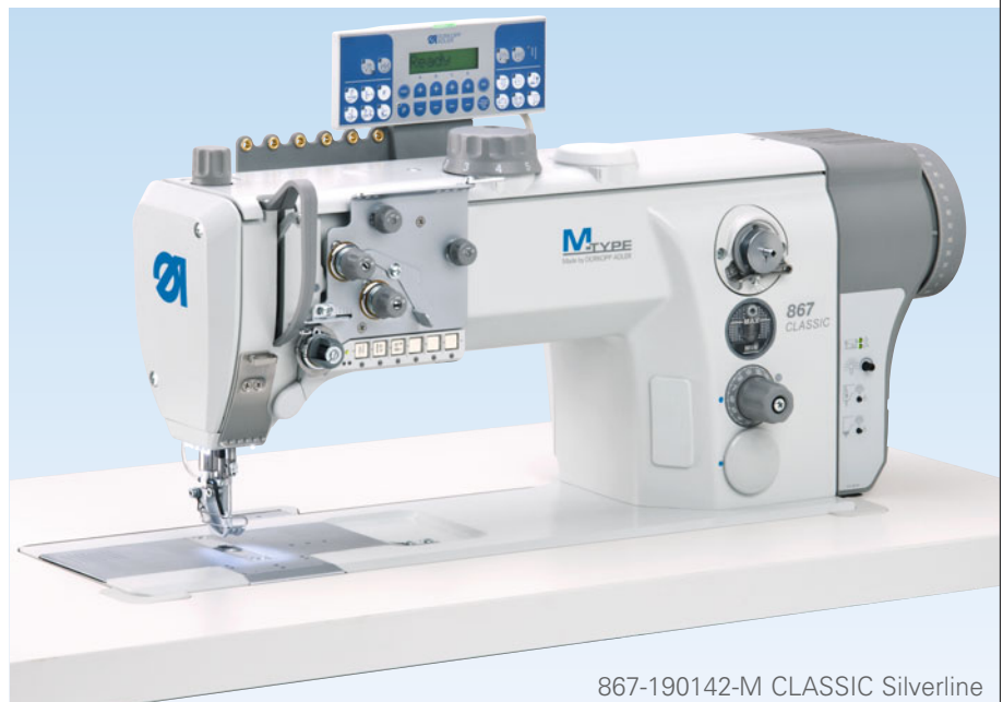
867-190142-M CLASSIC Silverline