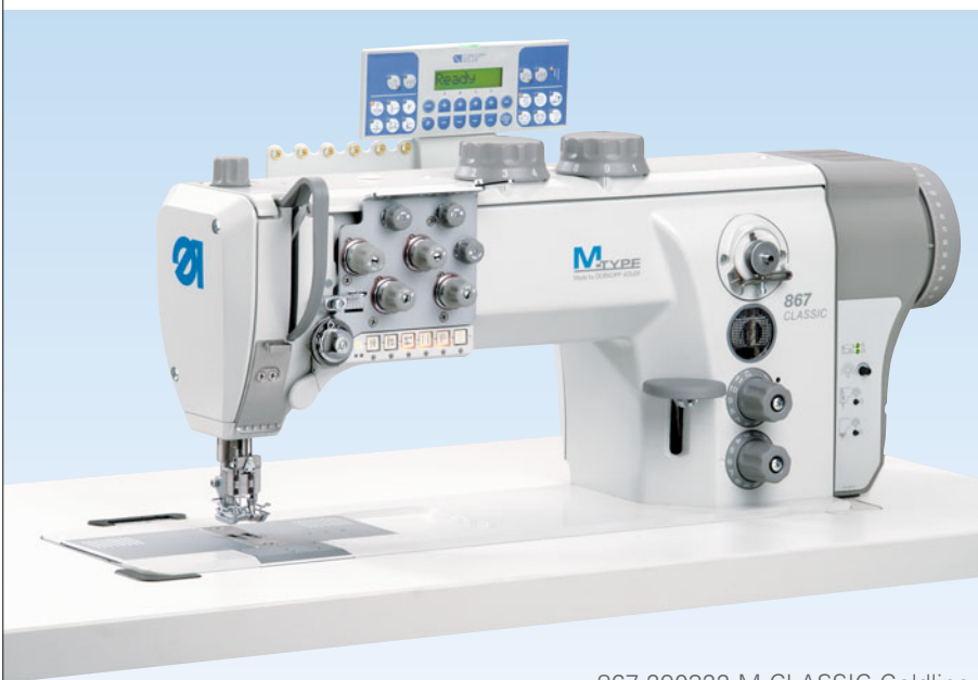
867-290322-M CLASSIC Goldline